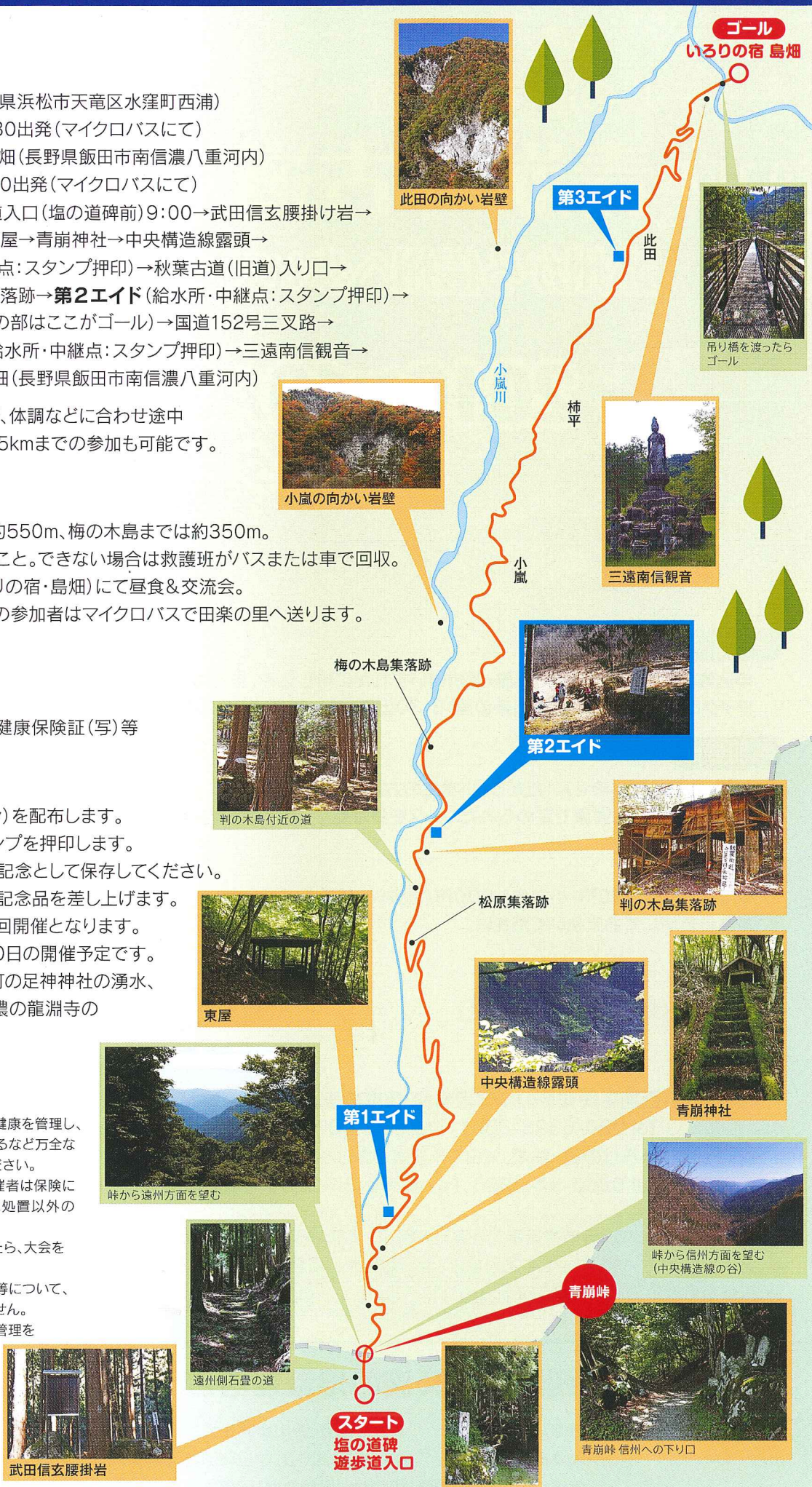
武田信玄腰掛け岩