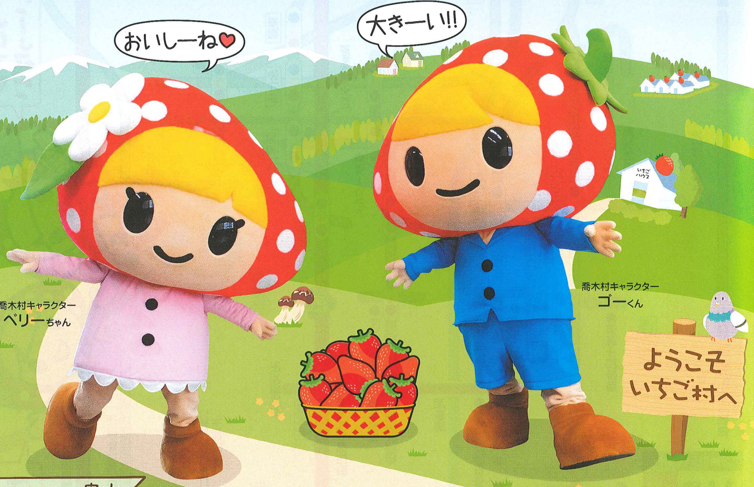
喬木村キャラクター ベリーちゃん

いちご狩り期間 2017年 1月7日 (土) ▶ 5月19日 (金) 受付時間 1~2月: 9:00~15:00 3~5月: 9:00~16:00