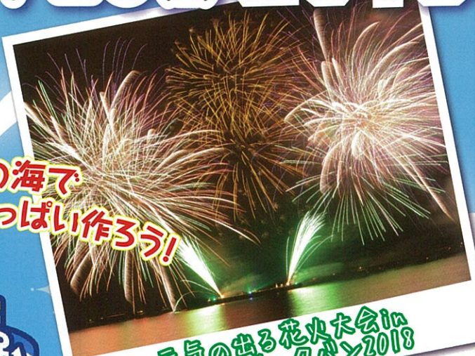
美浜の海で 夏の思い出いっぱい作ろう!