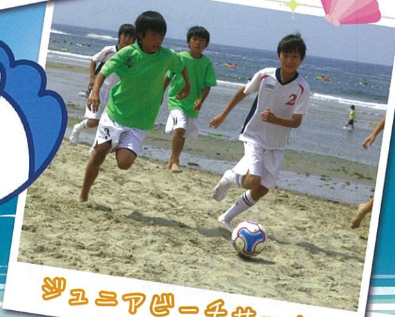
ジュニアビーチサッカー