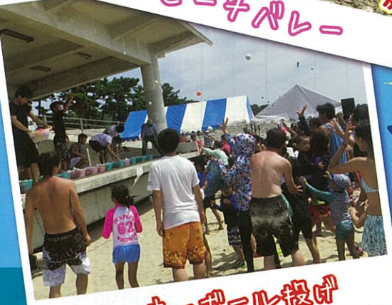
ラッキークール投げ