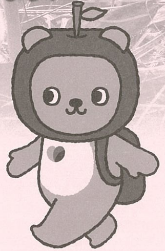
長野県PRキャラクター「アルクマ」 ©長野県アルクマ