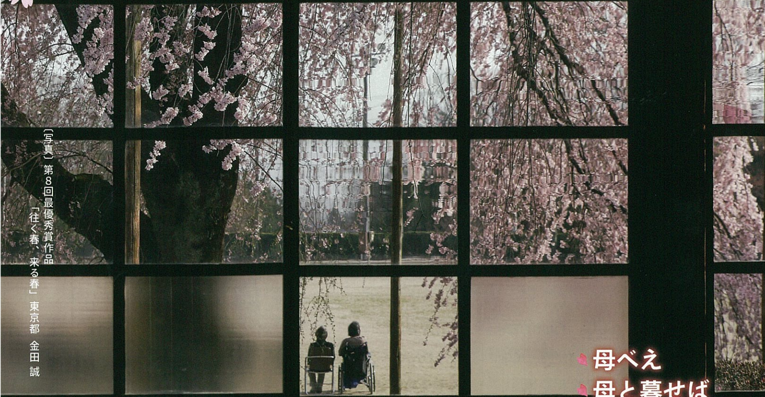
〔写真〕第8回最優秀賞作品 「往く春、来る春」東京部 金田誠