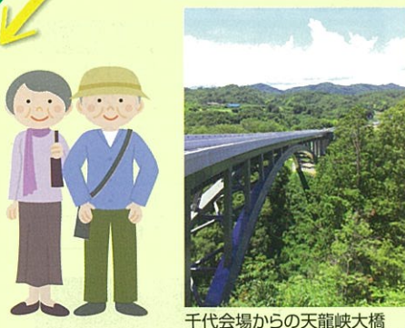
千代会場からの天龍峡大橋