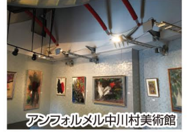
アソナルメル中川村美術館