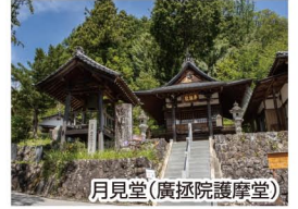
月見堂(廣経院護摩堂)