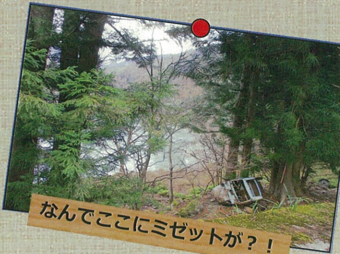
なんでここにミゼットが？！