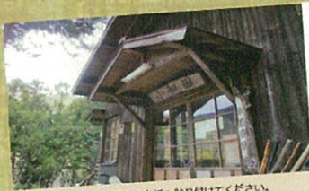
乗車券はご利用後に台紙へ貼り付けてください。

天竜峡駅または飯田駅で往復乗車券を購入して ご乗車いただいたお客様に記念台紙をプレゼント (乗車券を貼り付けることができます)