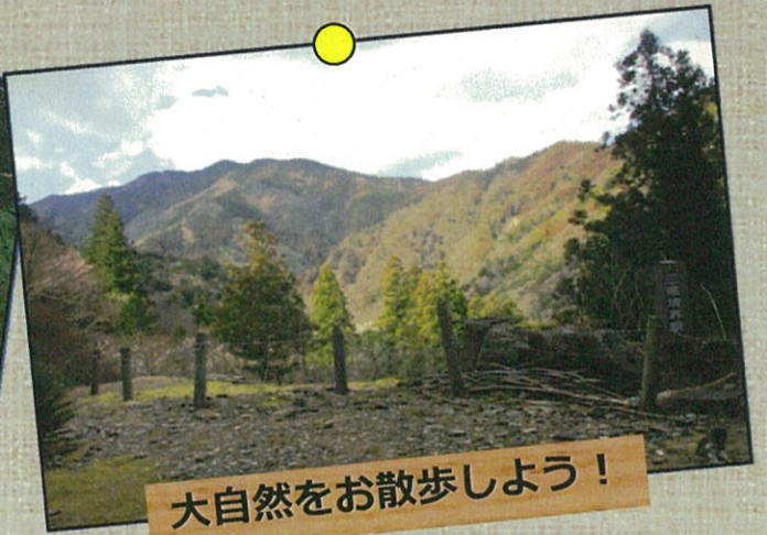
大自然をお散歩しよう！

天竜峡駅または飯田駅で往復乗車券を購入して ご乗車いただいたお客様に記念台紙をプレゼント (乗車券を貼り付けることができます)