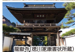
龍嶽寺(徳川家康書状所蔵)