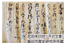
武田朱印状(平沢文書) 飯田市歴史研究所所蔵