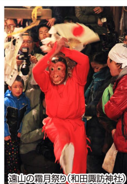
遠山の霜月祭り(和田諏訪神社)

行程 (1日目)りんごの里(13:30)→道の駅遠山郷(休憩)→和田諏訪神社(霜月祭り見学※一の湯、下堂破い、二の湯など)→島畑(夕食)→和田諏訪神社(霜月祭り見学※面の登場、神送りなど※霜月祭り終了予定24時)→島畑(宿泊) (2日目)島畑(9:00)→道の駅遠山郷(ふじ姫饅頭ご購入)→りんごの里(10:45) ※新型コロナ感染状況により、霜月祭りの中止や入場制限、また時間変更などの可能性があります。 ※宿泊状況により、一部の宿泊先が別の宿泊施設(和岡周辺)になる場合があります。