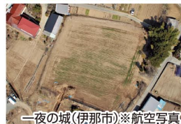
一夜の城(伊那市)※航空写真