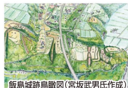
飯島城跡鳥瞰図(宮坂武男氏作成)