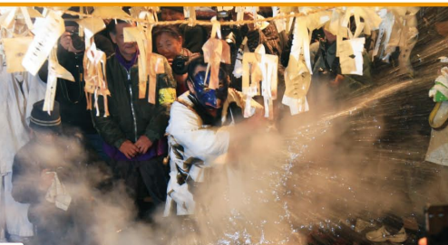
遠山の霜月祭り(和田諏訪神社)