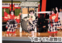
下條子ども歌舞伎