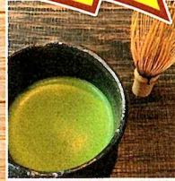
高校生による 呈茶