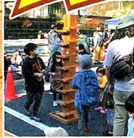
木のおもちゃ 展示