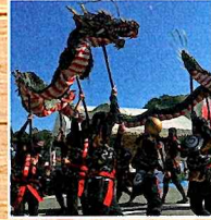
天龍峡龍神の舞と 記念撮影