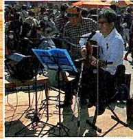
バンド フェスティバル