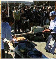
ジャンボちくわ 実演・試食