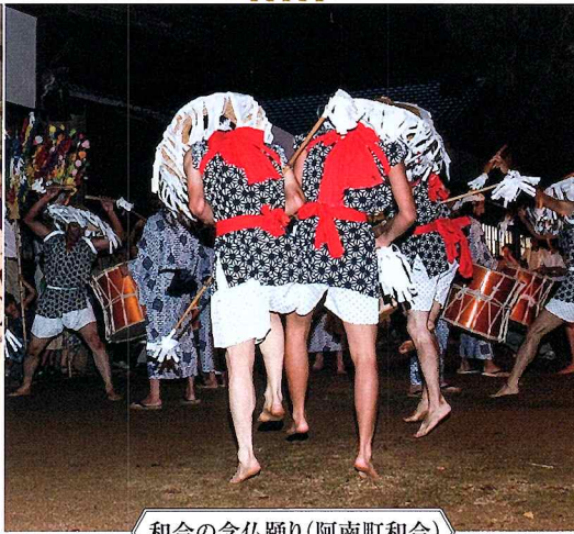
和合の念仏踊り(阿南町和合)