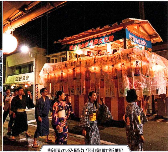
新野の盆踊り(阿南町新野)

令和4年11月に「風流踊」がユネスコ無形文化遺産に登録されました。 今回のフェスティバルは、長野県内で登録となった3つの風流踊が一堂に会する貴重な機会です。ぜひご来場ください。